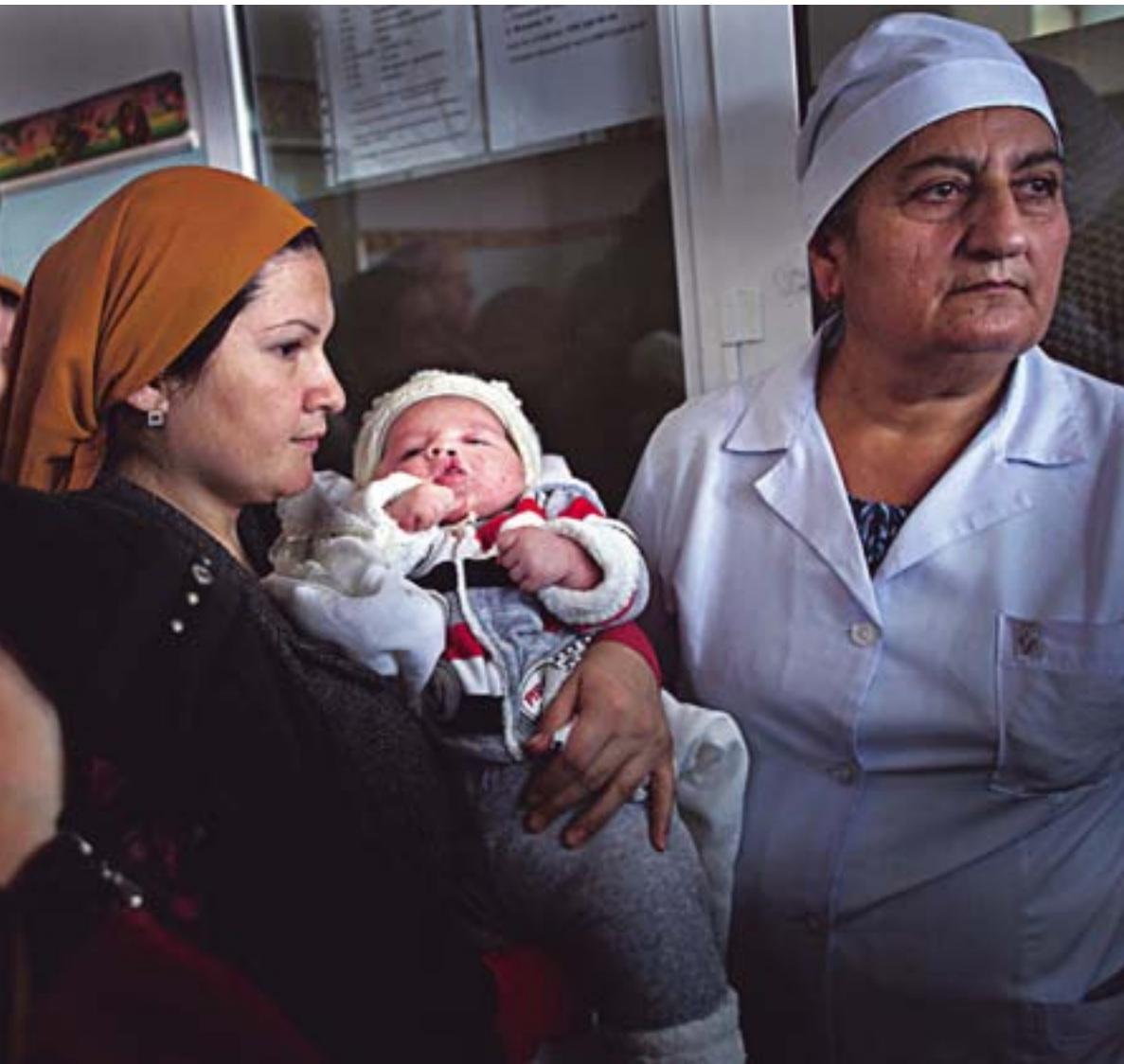
Het centrum voor plastische chirurgie in Grozny, waar de 'Operation Smile-marathon' van start ging: honderden kinderen uit de noordelijke Kaukasus werden hier geopereerd.

Het is een ware chirurgenmarathon, een mini-industrie die wordt ondersteund en gesponsord door Hollywoodsterren. Het is dé kans voor arme kinderen op gratis medische hulp. Geen wonder dat ik op het idee kwam om Operation Smile naar Tsjetsjenië te halen. Ik wilde zó graag dat hier, in mijn kleine landje, de beste artsen ter wereld zouden komen om de jonge Tsjetsjeense kinderen in de afgelegen bergdorpen te helpen. Voor die eenvoudige bergbewoners is zelfs een reisje naar zee al een gebeurtenis. Stel je dan eens voor dat ze bezoek zouden krijgen van beroemde geneeskundigen uit Harvard, Zürich, Berlijn en Tokio!